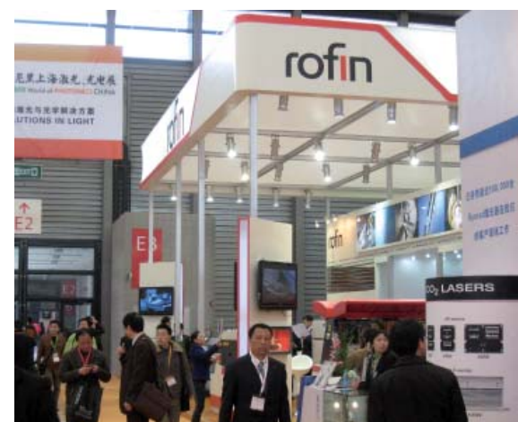
Messestand von Rofin Sinar. Laserproduzent in Deutschland und China.